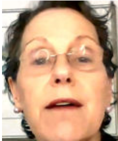
Prof. Anat Ruth Admati Graduate School of Business, Stanford University, Palo Alto, California, USA (BSc Jerusalem, MA/PhD Yale)

Ende der Credit Suisse konnte somit jedoch nicht abgewendet werden. Die Anforderungen seien denn auch viel zu tief findet die renommierte Finanzprofessorin von der Stanford University. Ihr schwebt eine Quote von 20% bis 30% vor.“